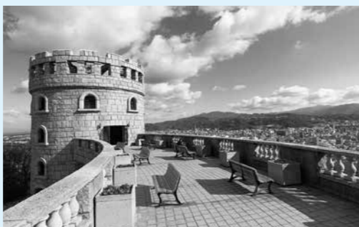
▲展望塔からの眺め

松山市街地を見渡す45.3haの広大な公園です。四季折々の花々を眺めながらの遊歩道ウォークは爽快です。